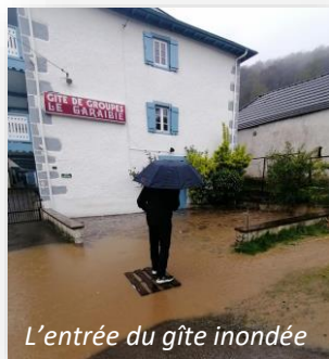
L'entrée du gîte inondée