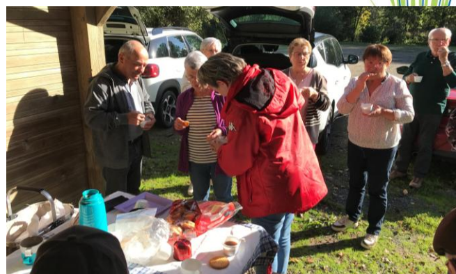
P'tit déj' d'accueil