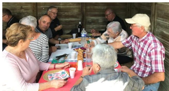
Gros Pique nique dans la cabane